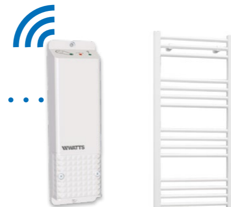
BT-WR02 FC RF