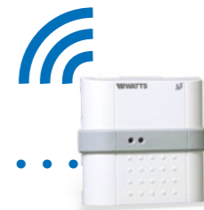
BT-FR02 RF Produit complémentaire exclu de l'offre package.